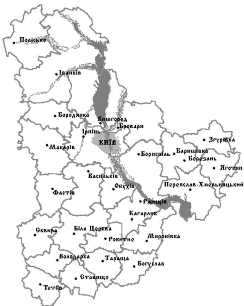
Рис. 1. Мапа поділу території Київської області на адміністративні райони

ління і децю доповнена, залишається переважно таким, який було встановлено за радянських часів за адміністративними механізмами тої пори. Тобто, без найменшого еколого-економічного аналізу розмірів і меж ДП_лісгоспів, формування їх організаційно-господарського