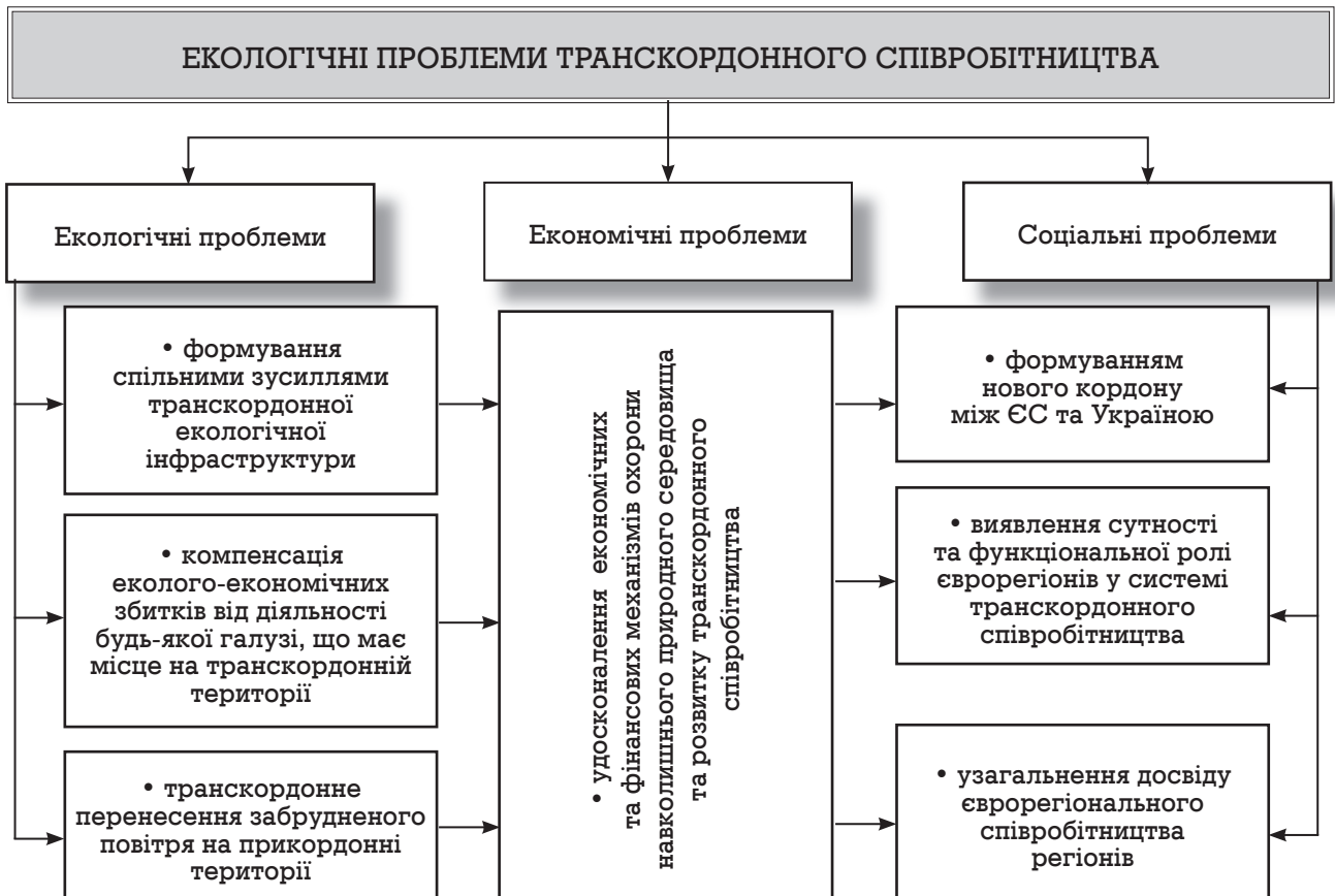
Рис. 2. Екологічні проблеми транскордонного співробітництва

проблем сучасності, розв'язання яких потребує участі усіх держав як на національному, так і на транснаціональному рівнях, особливо держав-сусідів. Науковці справедливо стверджують, що екологічні проблеми не обмежуються на-