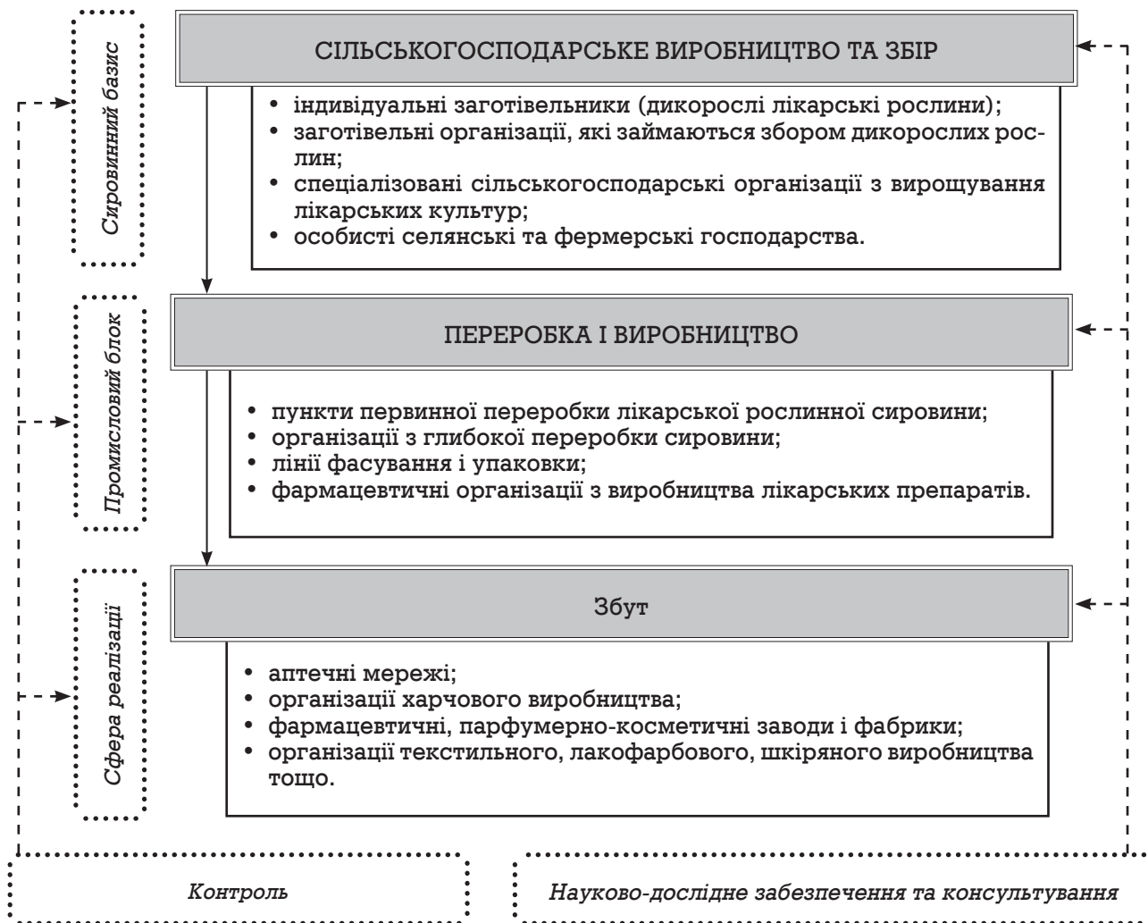
Рис. 1. Структурно-функціональна схема ринку лікарської рослинної сировини