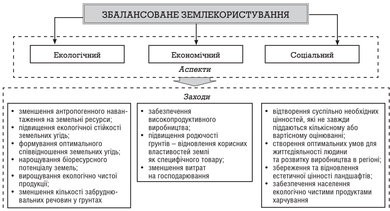
Рис. 1. Аспекти забезпечення збалансованого землекористування

Вищенаведені заходи як інструменти забезпечення раціонального землекористування та охорони земель спрямовані на вирішення проблем сталого розвитку [5; 6; 7; 1]. На рис. 1 показує розподіл заходів на екологічний, економічний та соціальний аспекти щодо забезпечення збалансованого землекористування.