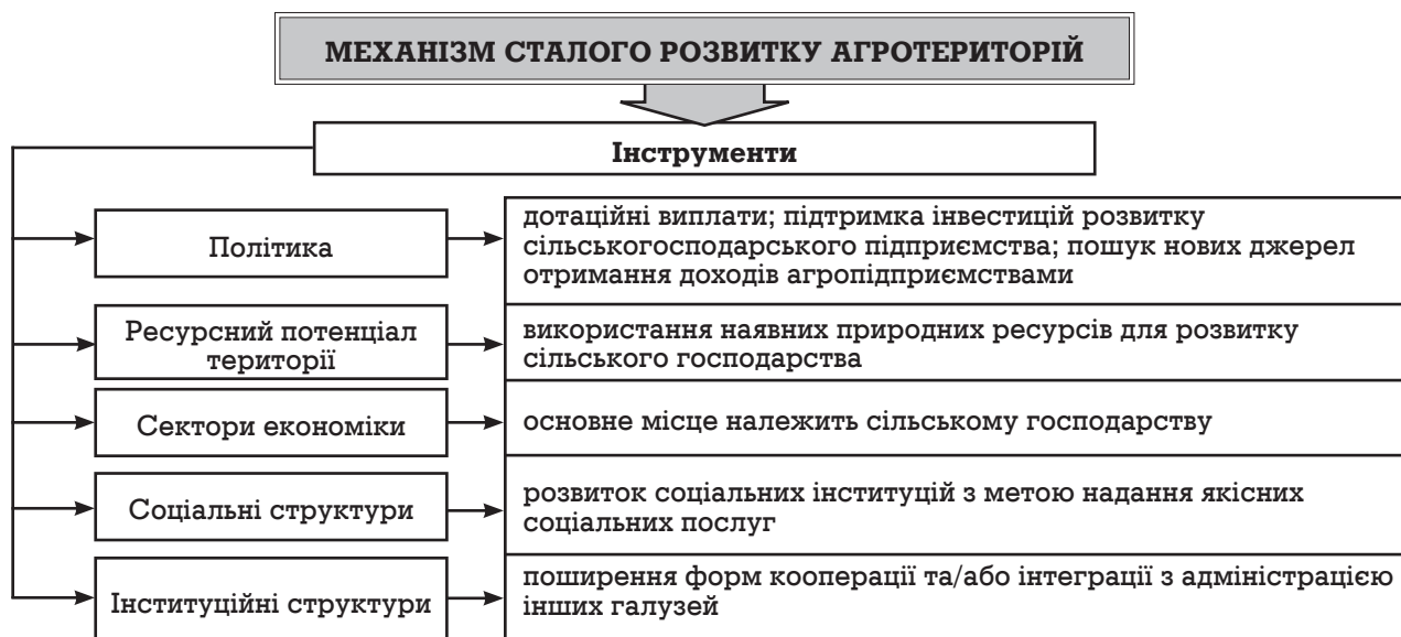
Рис. 3. Схема механізму сталого розвитку функціонування агротериторій на основі перерозподільної моделі (розроблено автором)