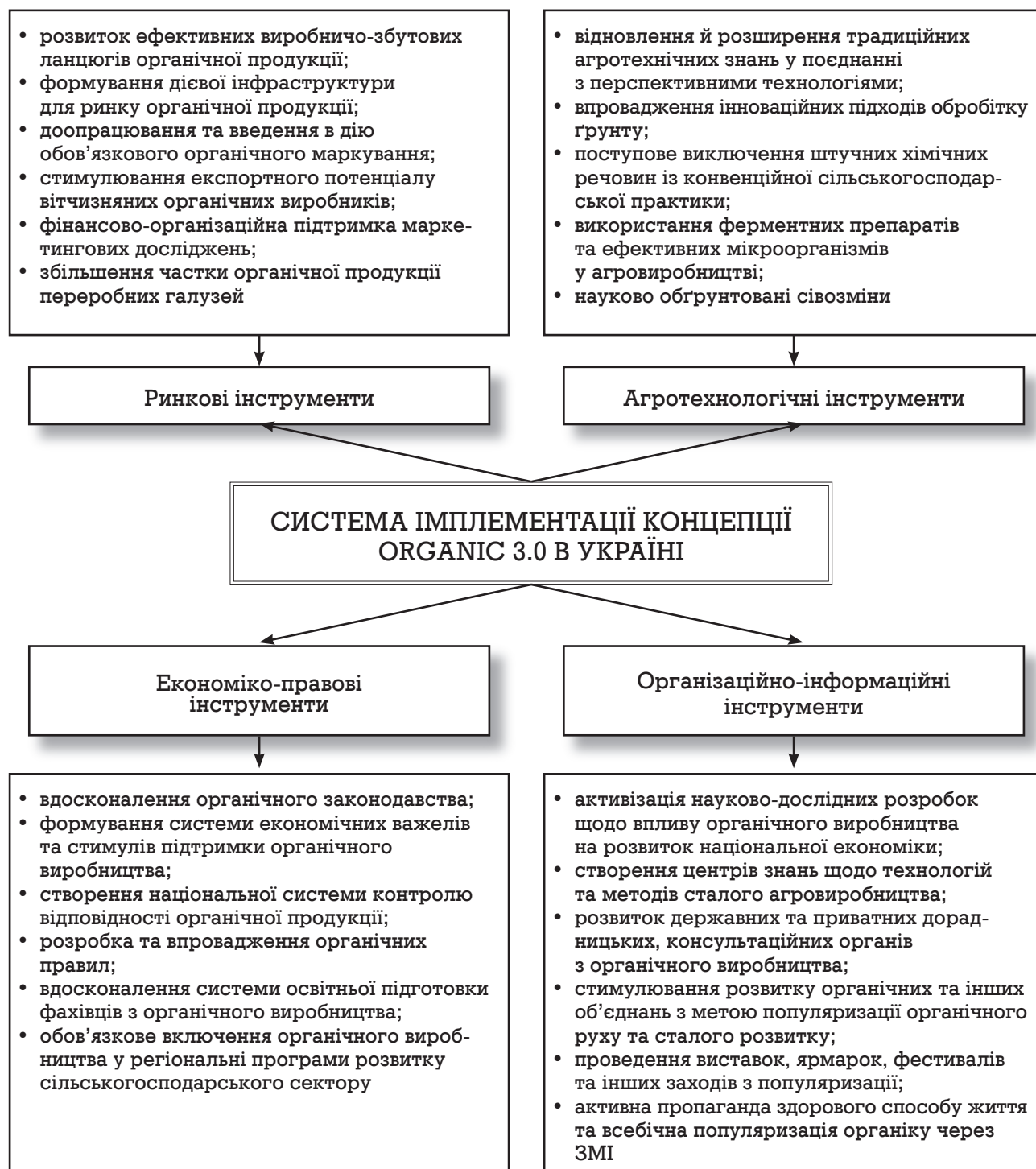
Рис. 2. Система заходів з впровадження концепції Organic 3.0 в Україні