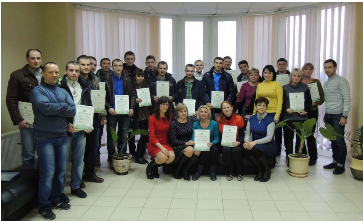
Матеріал підготували: А.В. Макаринська, І.О. Відоменко

Проведений семінар був корисний обом сторонам: працівники філії «Внутрішньогосподарський комплекс по виробництву кормів» ТОВ «Вінницька птахофабрика» отримали нові знання, відповіді на свої запитання та сертифікати, які підтверджують проходження підвищення кваліфікації на семінарі, а для Одеської національної академії харчових технологій цей семінар став яскравим іміджевим заходом, який засвідчив, що ОНАХТ – це ВНЗ, який має висококваліфікованих викладачів та провідних науковців. Крім того, в рамках даного семінару викладачі також мали змогу детально ознайомитися з технологічними особливостями виробництва комбікормів на ТОВ «Вінницька птахофабрика», що дозволить використати цей досвід під час учбового процесу в ОНАХТ.