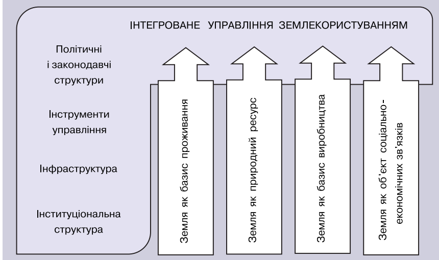
СХЕМА ІНТЕГРОВАНОГО УПРАВЛІННЯ ЗЕМЛЕКОРИСТУВАННЯМ