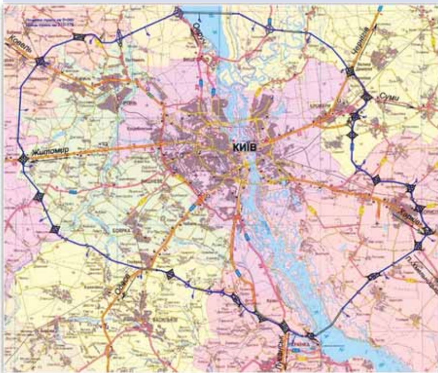
Схема Великої кільцевої автомобільної дороги навколо міста Києва