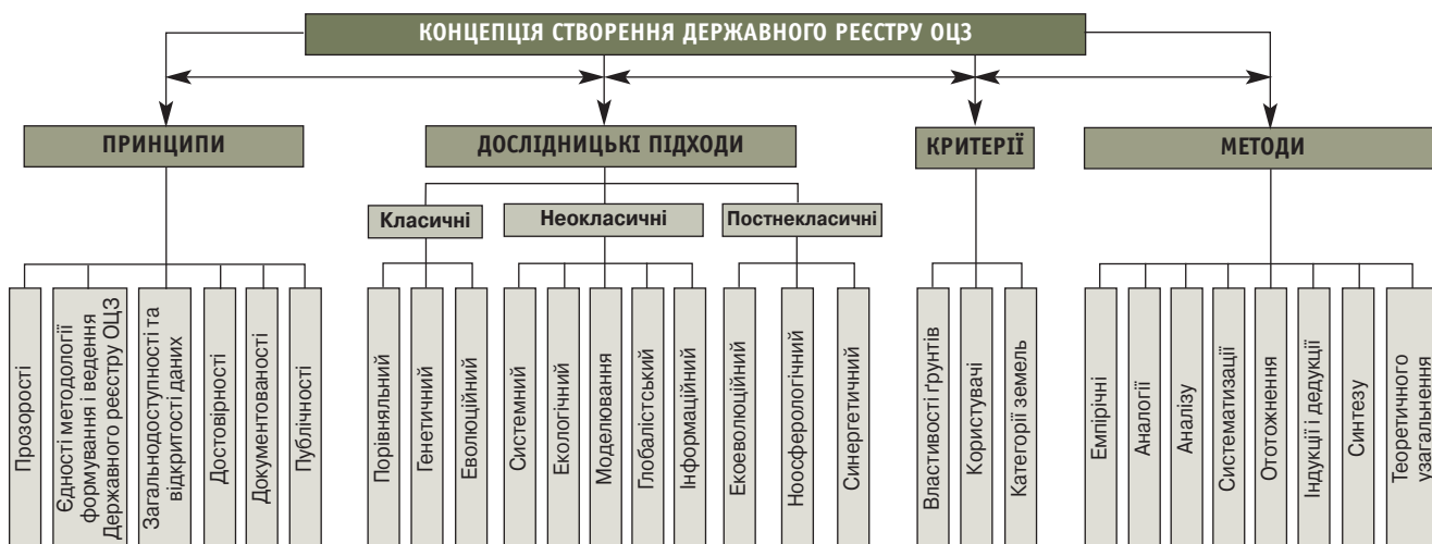
ГРАФІЧНА МОДЕЛЬ, ЯКА ВІДБРАЖАЄ МЕТОДОЛОГІЧНІ ЗАСАДИ КОНЦЕПЦІЇ СТВОРЕННЯ ДЕРЖАВНОГО РЕЄСТРУ ОЦЗ