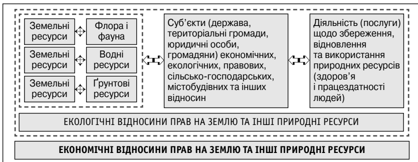
Рис. 2. ЛОГІЧНО-СМІСЛОВА МОДЕЛЬ СУТНОСТІ ПРИРОДООХОРОНОНОГО ЗЕМЛЕКОРИСТУВАННЯ

Беззмістовне визначення земельних екологічних відносин втрачає своє методологічне значення та практичне застосування, а викривлене, підмінне визначення змісту права власності на землю, що наразі зафіксоване у статті 78 ЗК України, не відображає реальний стан земельних еколо-