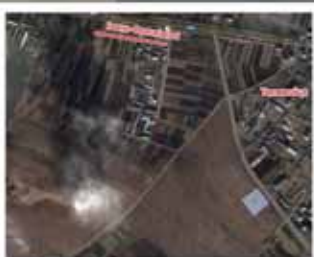
1. Земельні ділянки в АТО