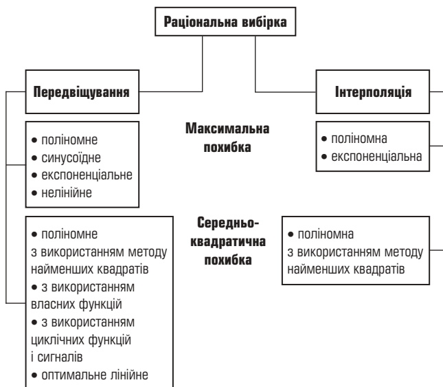
Рис. 2. Класифікація методів раціональної вибірки

Залежно від того, який апарат математичної статистики використовується, методи, що входять до цієї групи, поділяють на два види: або з передвіщанням (екстраполяцією), або з інтерполяцією (рис. 2).