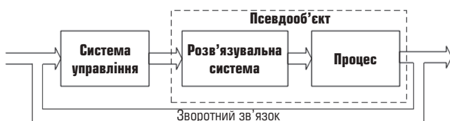
Рис. 1. Загальна структура розв'язувальної системи управління

Популярний підхід до розв'язання проблеми зв'язності контурів управління полягає у створенні незв'язних або розв'язаних схем управління. Завдання при цьому — повністю усунути ефект зв'язності контурів, що досягається визначенням компенсаційних мереж, відомих як розв'язувальні системи (рис. 1). По суті, роль розв'язувальних систем зводиться до розкладання багатовимірного процесу на серію незалежних одноконтурних підсистем. Якщо цього буде досягнуто, то матимемо повну, або ідеальну, розв'язку, і, отже, багатовимірний процес може бути керований за допомогою незалежних контурів управління.