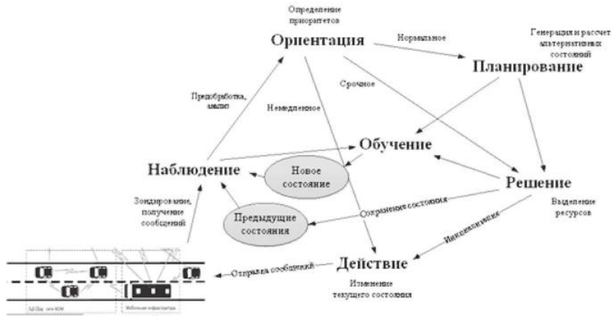
Рис. 5. Когнитивный цикл транспортной магистрали