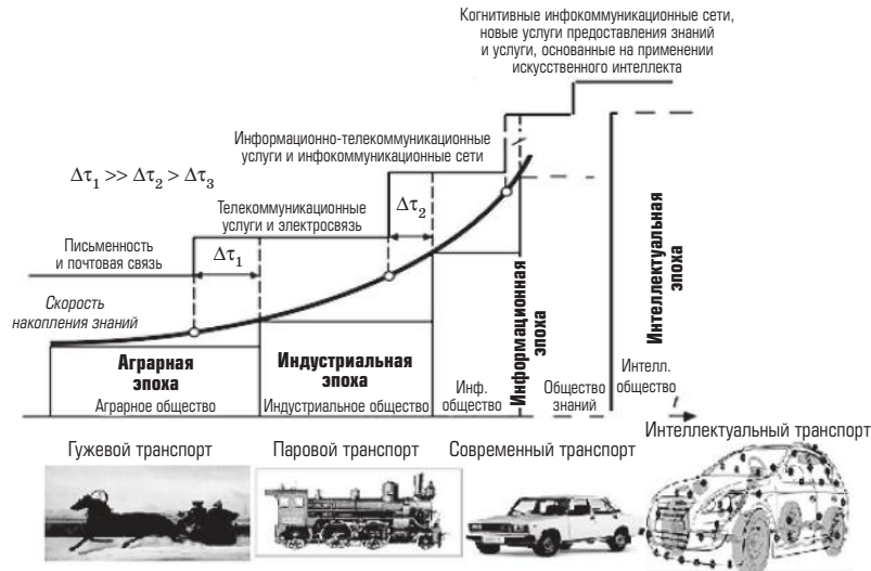
Рис. 1. Коэволюция информационных, индустриальных и транспортных технологий

Решение проблемы построения перспективной когнитивной транспортной системы (КТС) декомпозируется на ряд взаимосвязанных подпроблем, важнейшей из которых является разработка и построение ее инфокоммуникационной подсистемы, посредством которой появляется возможность интегрировать другие подсистемы КТС.