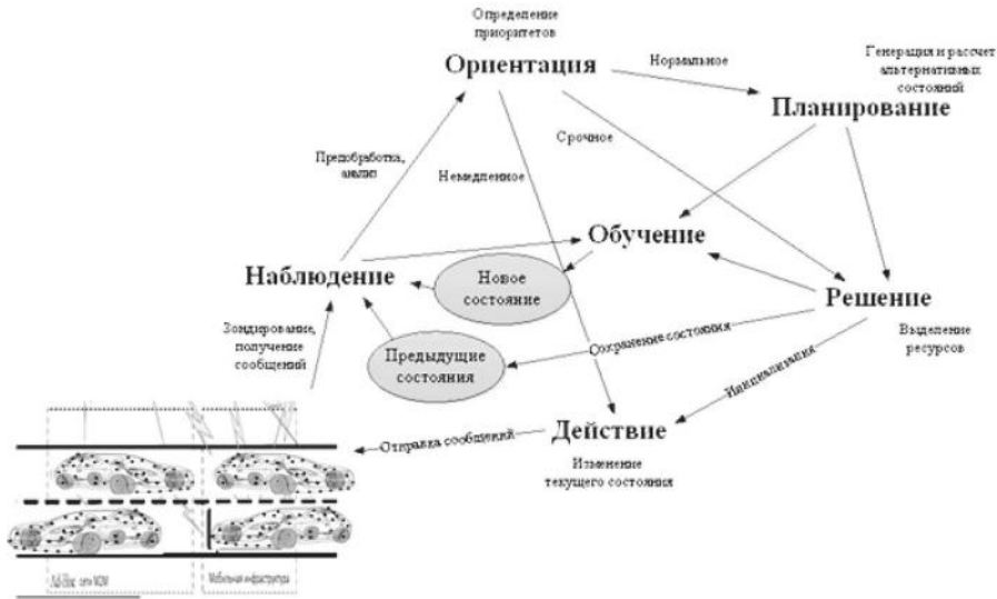
Рис. 3. Когнитивный цикл транспортной системы

Когнитивный цикл транспортной системы представлен на рис. 3, который содержит ее инфраструктурные элементы (автомобили, светофоры, остановки и т. д.) разной степени интеллектуальности. При более тщательном рассмотрении в когнитивном цикле транспортной системы могут быть выделены подциклы, охватывающие отдельно каждое транспортное средство (рис. 4) и транспортные магистрали (рис. 5).