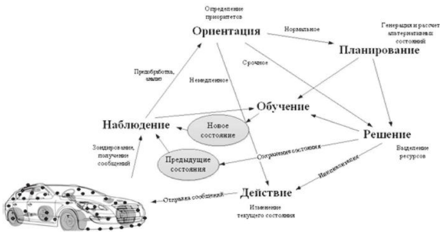
Рис. 4. Когнитивный цикл транспортного средства

Циклы транспортного средства начинаются с сетей датчиков, охватывающих его различные активные и пассивные элементы, и оканчиваются исполнительными устройствами, оказывающими управляющие воздействия на основные активные элементы транспортного средства.