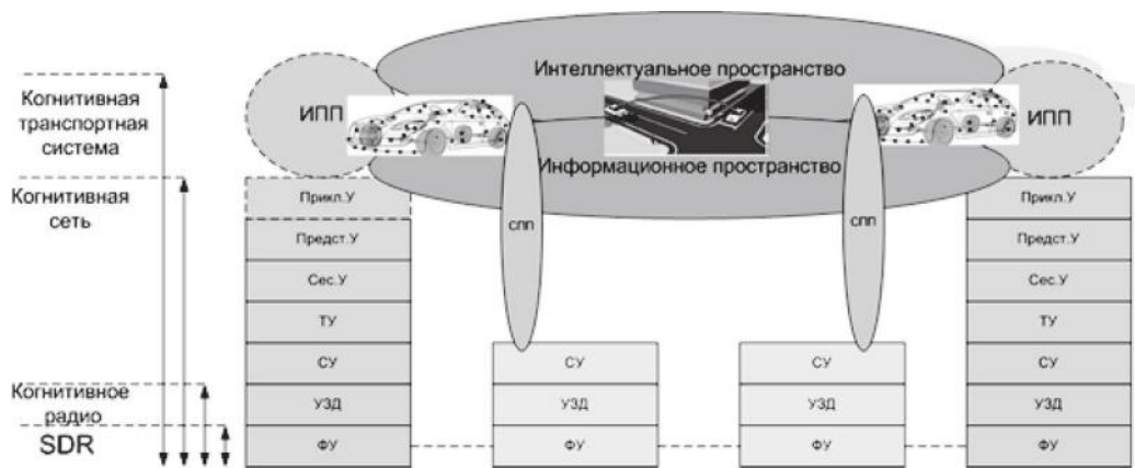
Рис. 6. Логическая многоуровневая архитектура когнитивной транспортной системы