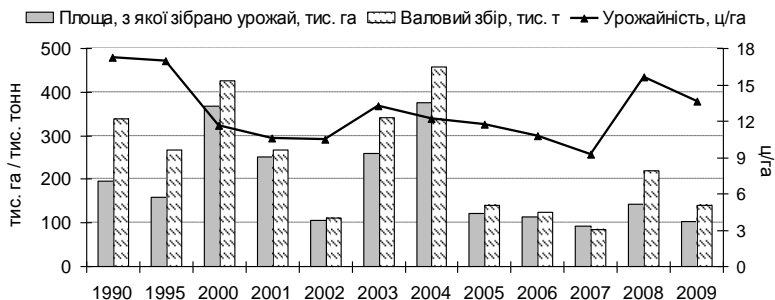
Рис. 3 – Динаміка виробництва зерна проса в Україні

Вузьким місцем виробництва проса і гречки є нестабільна врожайність, яка пов'язана з недостатнім рівнем адаптивності сортів до стресових умов довкілля, погіршенням культури землеробства, недостатнім ресурсним забезпеченням технологій вирощування, а також системи та організації насінництва створених сортів. Ця проблема може бути вирішена шляхом створення та впровадження у виробництво нового високопродуктивного, високоадаптивного покоління сортів та технологій, здатних реалізувати їх генетичний потенціал. Особливе значення надається створенню сортів різних строків дозрівання з метою впровадження їх у виробництво в різних агрокліматичних зонах України.