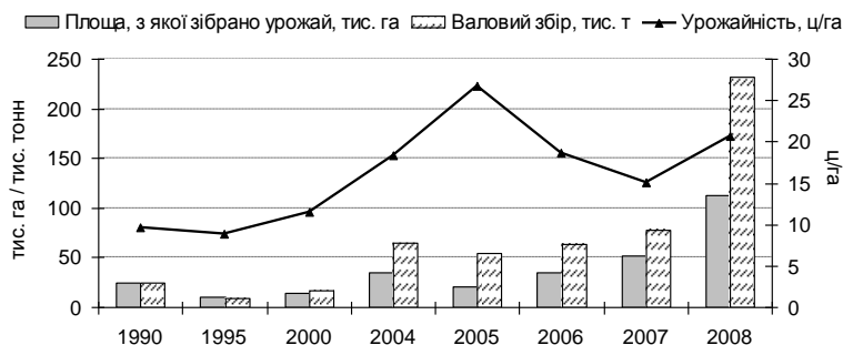
Рис. 5 – Динаміка виробництва сорго зернового в Україні

дуже далекий від потенційних можливостей культури.