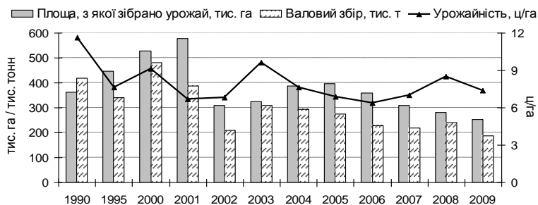
Рис. 4 – Динаміка виробництва зерна гречки в Україні.

Вузьким місцем виробництва проса і гречки є нестабільна врожайність, яка пов'язана з недостатнім рівнем адаптивності сортів до стресових умов довкілля, погіршенням культури землеробства, недостатнім ресурсним забезпеченням технологій вирощування, а також системи та організації насінництва створених сортів. Ця проблема може бути вирішена шляхом створення та впровадження у виробництво нового високопродуктивного, високоадаптивного покоління сортів та технологій, здатних реалізувати їх генетичний потенціал. Особливе значення надається створенню сортів різних строків дозрівання з метою впровадження їх у виробництво в різних агрокліматичних зонах України.