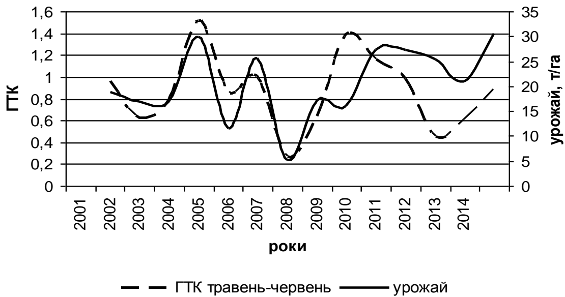
Рисунок 1. Урожайність ранньостиглих сортів та гібридів в конкурсно-екологічному випробуванні картоплі першого року та гідротермічний коефіцієнт за 2001-2014 рр.