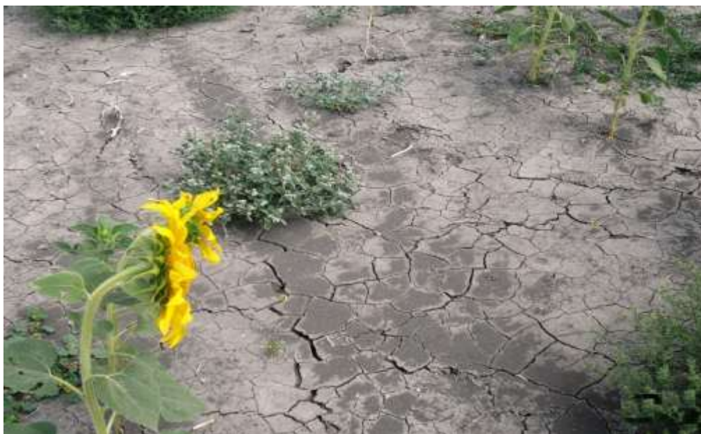
Fig. 2. Photo of a process of reducing the fertility of irrigated land and soil degradation and desertification

Basic requirements for providing of self-supporting balance of humus and its content at the level of 2.5-3.5% under the conditions of irrigation is: