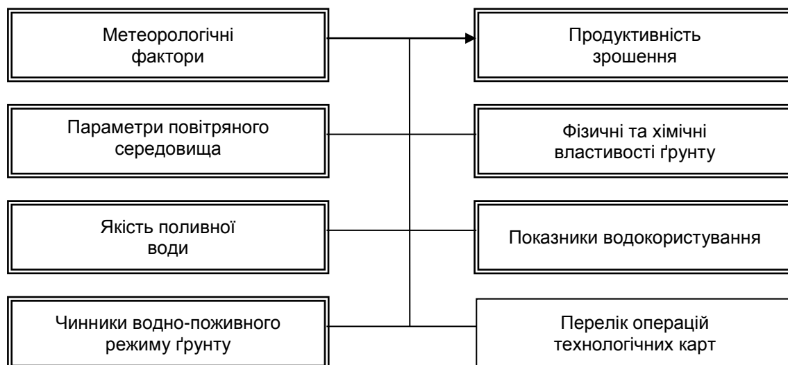
Рисунок 2. Схема впливу основних факторів на продуктивність зрошення на локальному рівні агропідприємства

➤ побудова та оцінка кореляційно-регресійних залежностей між групами чинників.