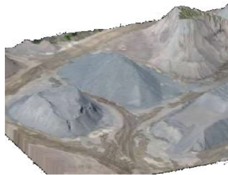
Рис. 2. 3D модель рельєфу