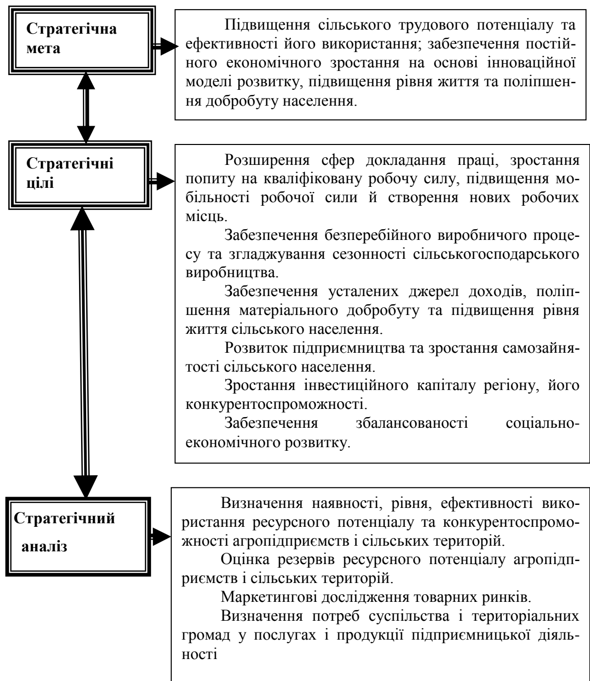
Рис. 2. Формування мети та цілей стратегії зростання трудової активності сільського населення*.