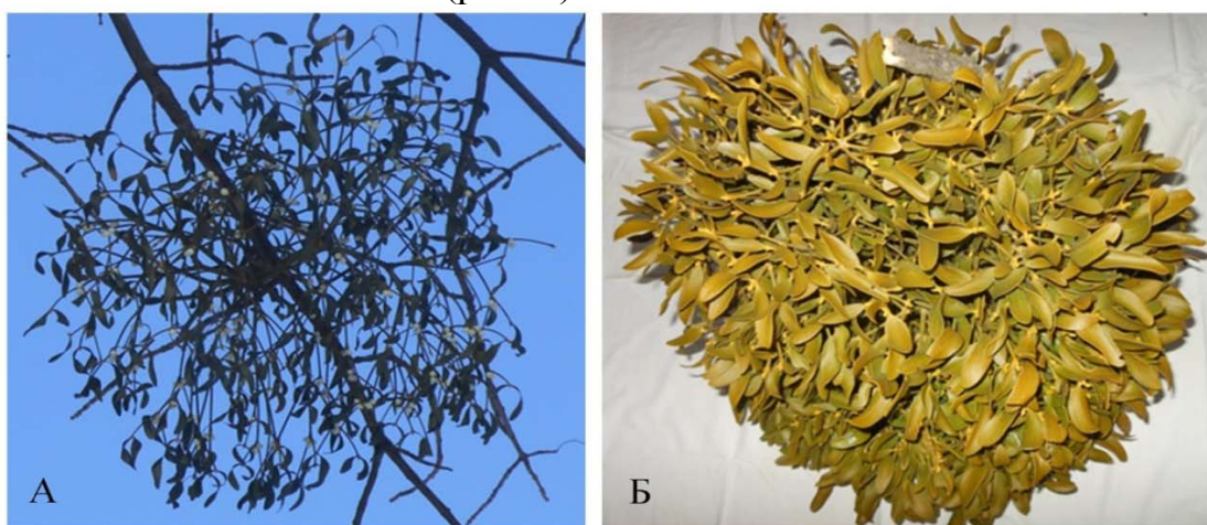
Рис. 1. Морфологічні відмінності омели в межах підвиду, що проростає на листяних породах: А – кущ омели на ясені звичайному, Б – кущ омели на акації білій

Разом з тим, нами виявлені істотні морфотипічні відмінності серед кущів омели, що уражають дерева одного виду. Це проявляється у середньому розмірі листків, ступені їх видовженості, кольору листків та гілок, а також у розмірах окремих гілок, їх товщині, у ступеню гілкування, у здатності утворювати повторні потовщення у місці прикріплення до рослини-хазяїна та у деяких інших особливостях (рис. 1).