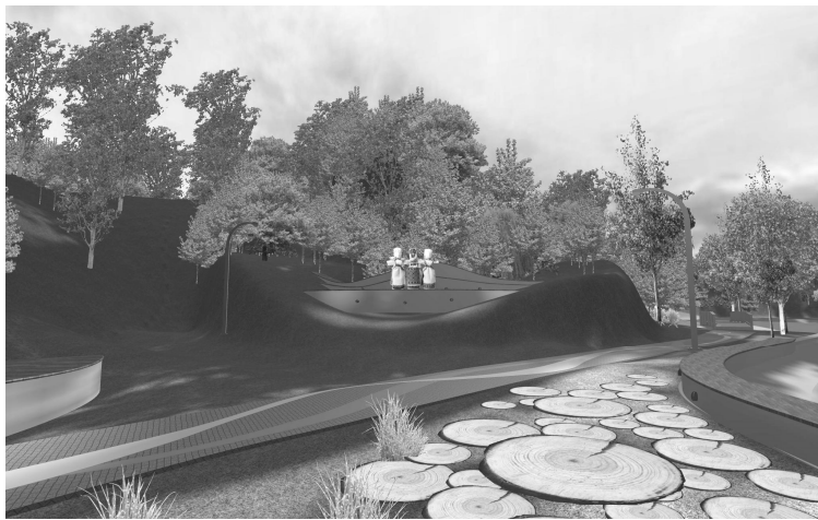
Рис. 4. Рішення сцени прийомом геопластики.

Ділянка навколо озера Дідорівка несе велике історико-культурне значення, тут проводять різноманітні дійства, етногуляння, у зв'язку з цим виокремлення зони масових заходів є необхідним. На цій території передбачене влаштування терас із застосуванням прийомів геопластики – штучної зміни рельєфу. Тераси, вимощені дерев'яними настилами, слугуватимуть імпровізованою сценою для проведення культурно-масових заходів за участю етноколективів (рис. 4). Водночас ці майданчики відкриватимуть далеку перспективу, яку можливо буде проглядати зі сторони парковки. Як фон «сцени» запропоновано влаштувати насадження із кущових видів рослин притаманних цим лісорослинним умовам. Із іншої сторони терас простягається схил, який у зимовий період може використовуватися як гірка для катання на санчатах. Крім того, у цій зоні доцільно влаштувати підходи до води, які необхідні для проведення традиційних гулянь, наприклад свята Івана-Купала. Вздовж сцени заплановано прокласти доріжку до місточка від якого починається зона вільхових боліт. Вона підлягає збереженню, як екоотоп, і роботи із благоустрою на цій території не передбачені.