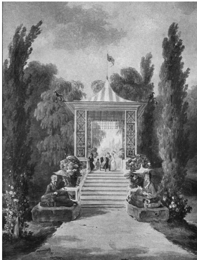
Рис. 3. Китайський місток.

На підвищенні рельєфу місцевості у вершині Великої галявини було створено унікальну архітектурну споруду – Амфітеатр «Луна» (рис. 4). Будівля має вигляд давньогрецького амфітеатру – напівциркулярна галерея, замкнута двома об'ємними приміщеннями, фасад якої нагадує собою відкриту колонаду з 14 колон Іонічного Ордеру. Перед колонадою розміщено