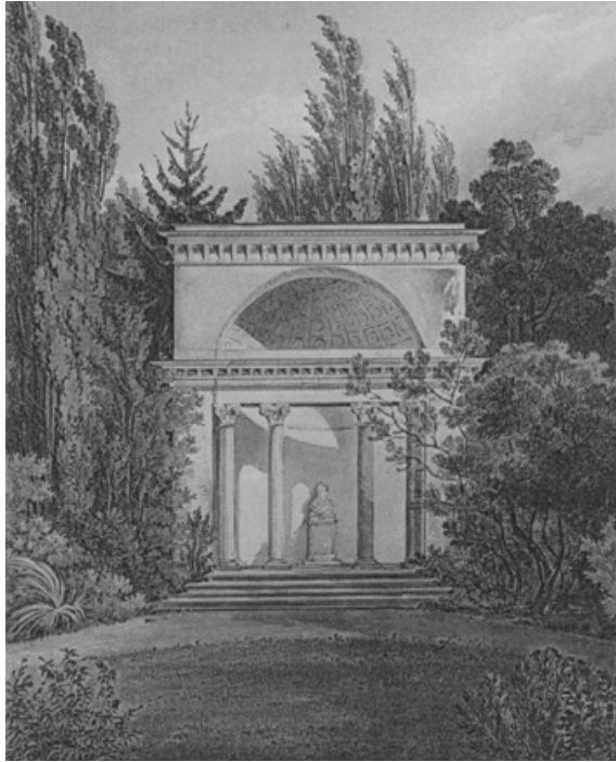
Рис. 8. Павільйон «Ротонда».

До меморіальних композицій парку «Олександрія» належить і «Шолом Багратіона». Петро Іванович Багратіон, князь, герой Вітчизняної війни 1812 року, був близьким другом сім'ї Браницьких. Він був одружений на Катерині Скавронській – внучатій племінниці князя Г. Потьомкіна, якій графиня Олександра Браницька була рідною тіткою. П. Багратіон неодноразово гостював у Браницьких і в один зі своїх приїздів подарував господарям свій військовий шолом. Загинув П. Багратіон в 1812 році, внаслідок важкого поранення під Бородіно. На згадку про цю видатну людину в «Олександрії» була встановлена колона, яку прикрашав шолом Багратіона. Поруч, над глибоким ярмом височів чудернацької форми пішохідний міст. Місце це було одним з улюблених і часто відвідувалося гостями парку (рис. 9).