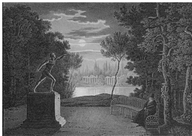
Рис. 11. Статуя "Гладіатор".

Найбільш численними романтичними композиціями в «Олександрії» є такі, що присвячені князю М.С. Воронцову – зятю графині О.Б. Браницької, видатній особистості Російської імперії, відомому полководцю і адміністратору. Першою присвяченою Воронцову парковою композицією була статуя "Гладіатор", встановлена між 1819-1822 рр., на постаменті якої викарбувано напис французькою: «Dedié au Michel Woronzow» (рис. 11).