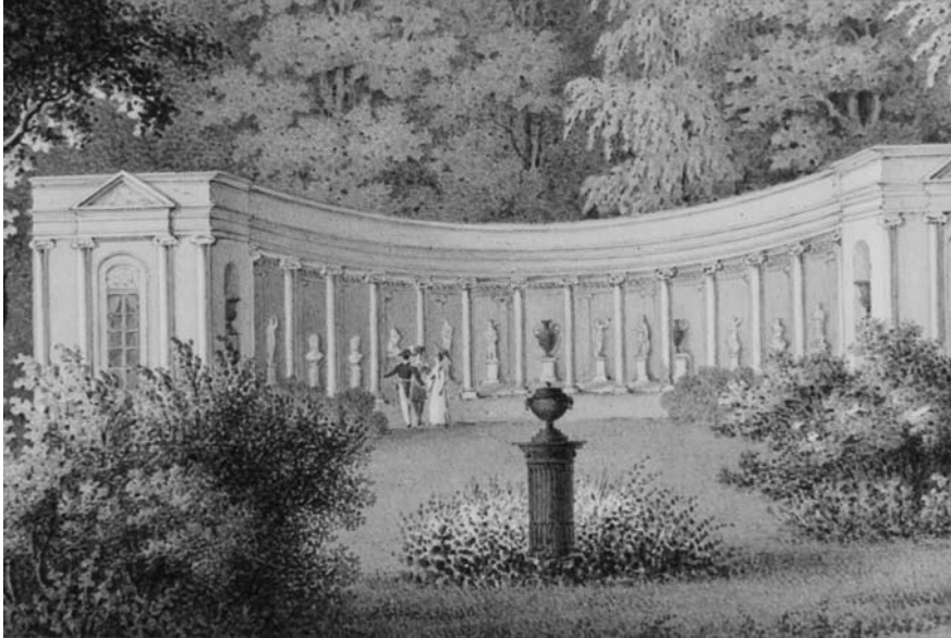
Рис. 4. Амфітеатр «Луна».

партерну зону зі скульптурою Меркурія. Входи ризалітів оформлені декоративними портиками з барельєфним зображенням молодої жінки, яка сидючи на стільці гойдає на нозі дитину. Ефективний зовнішній вигляд та краса споруди поєднані з її особливими акустичними властивостями. Слово, сказане пошепки в одному кінці, добре чути в іншому, незважаючи на відстань в 34 метри.