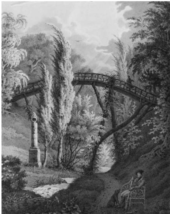
Рис. 9. Колона з шоломом Багратіона.

До меморіальних композицій парку «Олександрія» належить і «Шолом Багратіона». Петро Іванович Багратіон, князь, герой Вітчизняної війни 1812 року, був близьким другом сім'ї Браницьких. Він був одружений на Катерині Скавронській – внучатій племінниці князя Г. Потьомкіна, якій графиня Олександра Браницька була рідною тіткою. П. Багратіон неодноразово гостював у Браницьких і в один зі своїх приїздів подарував господарям свій військовий шолом. Загинув П. Багратіон в 1812 році, внаслідок важкого поранення під Бородіно. На згадку про цю видатну людину в «Олександрії» була встановлена колона, яку прикрашав шолом Багратіона. Поруч, над глибоким ярмом височів чудернацької форми пішохідний міст. Місце це було одним з улюблених і часто відвідувалося гостями парку (рис. 9).