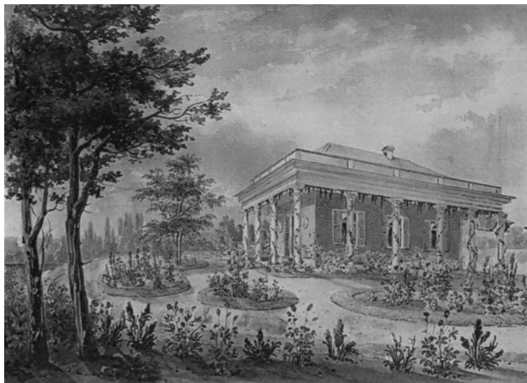
Рис. 13. «Турецький будиночок».

Графу Воронцову і подіям пов'язаним з російсько-турецькою війною 1828-1829 рр., присвячена в «Олександрії» ще одна цікава композиція – «Турецький будиночок» (рис. 13). Споруда знаменита тим, що при будівництві в її стіни було вмуровано 2 мармурові плити з написами давньотурецькою мовою. Ці плити, привезені з Болгарії, перебували на стінах фортеці «Варна» і прославляли велич шаха Махмуда Хан Газі. Після того як російські війська підкорили цю, як здавалося неприступну фортецю, граф Воронцов демонтував ці плити і привіз як трофей і подарував їх своїй тещі – графині О. Браницькій.