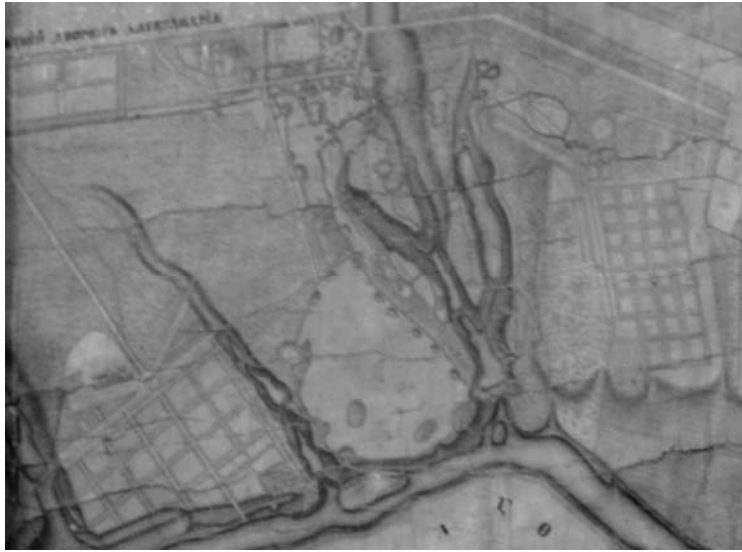
Рис. 1. План парку «Олександрія».

популярним в Європі та Росії в середині та кінці XVIII ст. В той час він розглядався як різновид і вдосконалення сприйняття пейзажних парків. Романтизм пропагував ідеалістичні, сільські та героїчні композиції, штучні руїни тощо [6].