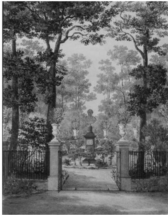
Рис. 10. Бронзовий бюст Олександра I.

На честь відвідування у 1816 та 1817 роках Білоцерківської резиденції графів Браницьких Імператором Олександром I в парку «Олександрія» було влаштовано композицію «Царський сад». На тому місці, де Імператор пив чай і спостерігав ілюмінацію, згодом було встановлено бронзовий бюст на гранітному п'єдесталі з бронзовою дошкою, на якій в лавровому вінку викарбовано зворушливий напис: «Воспоминания радости и печали» (рис. 10).