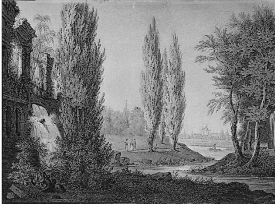
Рис. 2. Штучні руїни античної споруди.