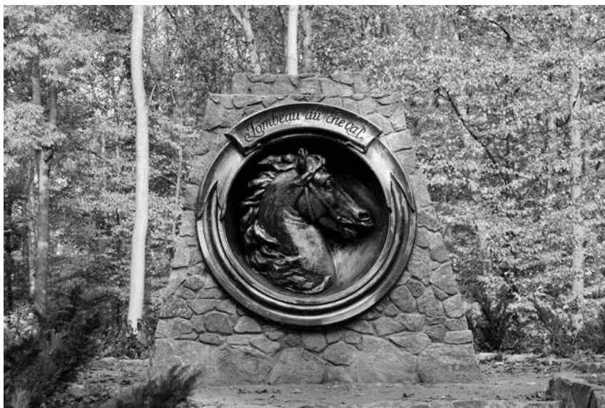
Рис. 6. Могила коня.

Особливо добре риси Романтизму в парку «Олександрія» відображено в створенні споруд та спеціальних меморіальних композицій, присвячених близьким для серця господарки особам та подіям. Такі меморіально-емблематичні риси, в першу чергу, чітко видно в композиції, створеній на честь Великого князя Г.О. Потьомкіна-Таврійського, рідного дядька графині, який відіграв в житті О. Браницької надзвичайно важливу роль. Віддаючи шану князю, О. Браницька вирішує після смерті Г. Потьомкіна створити в «Олександрії» на честь останнього мавзолей. Зберігся проект цього мавзолею, виконаний відомим російським архітектором І. Старовим (рис. 7). З невідомих причин будівництво мавзолею не відбулося, натомість в парку «Олександрія» господарка створила на честь Г. Потьомкіна Дружній сад, окрасою якого був павільйон «Ротонда» з встановленим всередині мармуровим бюстом князя (рис. 8).