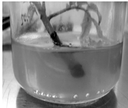
Рис. 2. Базальна частина первинного експланта грецького горіха.

Для грецького горіха та фундука, з метою подолання проблем фенолоутворення, пропонуємо наступні заходи: культивування маточних рослин за розсіяного світла в умовах депозитарію; використання антиоксиданта аскорбінової кислоти для замочування експлантів перед стерилізацією; введення рослин шляхом виділення меристем, пробуджених бруньок; додавання біоциду PPM (Plant