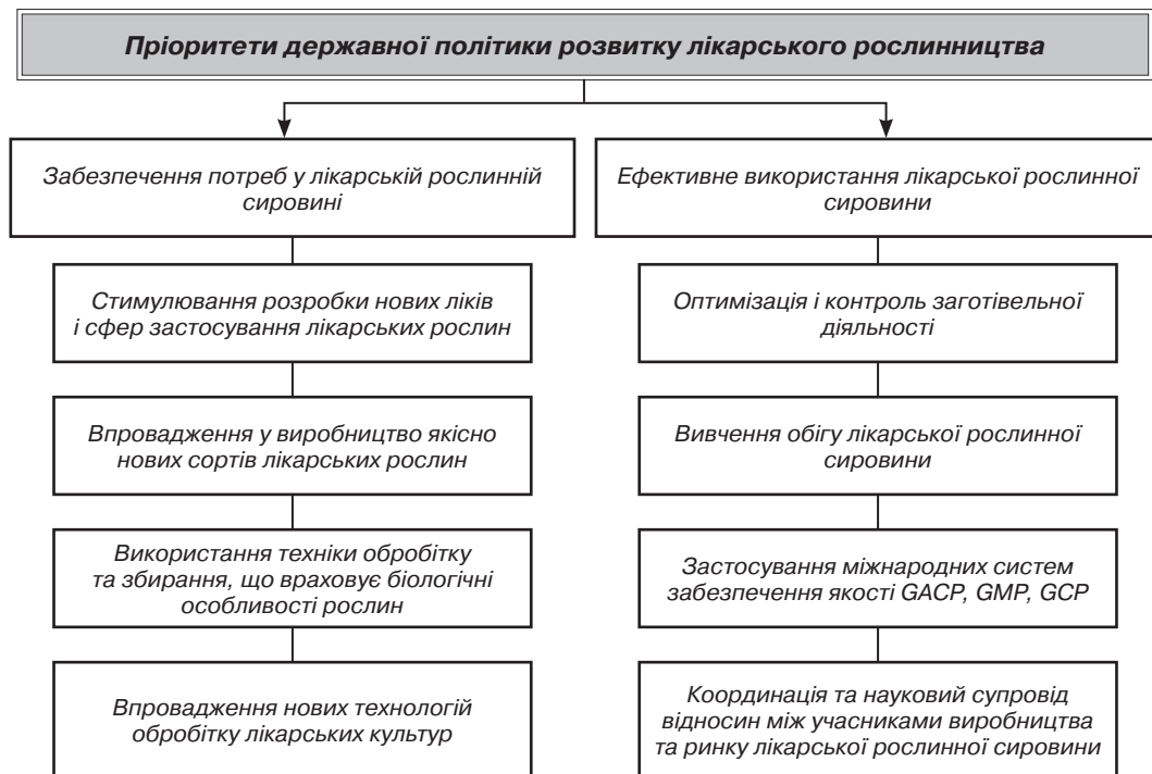
Рис. 2. Пріоритети державної політики розвитку лікарського рослинництва в Україні

Слід відзначити основні перспективи та пріоритети розвитку лікарського рослинництва (рис. 2), до складу яких входять: стимулювання розробки нових ліків і сфер застосування лікарських рослин; впровадження у виробництво якісно нових сортів лікарських рослин; використання техніки обробітку та збирання, що враховує біологічні особливості рослин; впровадження нових технологій обробітку лікарських культур