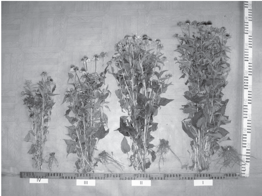
Рис. 1. Розвиток рослин ехінацеї пурпурової за різного ступеня ураження церкоспорозом