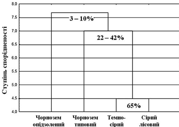
Рис. 1. Дендрограма подібності природних екосистем різних типів ґрунтів за ступенем кореляційних зв'язків між мікробними угрупованнями

В усіх досліджених екосистемах відзначено існування сильних кореляційних зв'язків між більшістю мікробних угруповань, і всі вони носять позитивний характер. Природні екосистеми темно-сірого ґрунту мають найвищий ступінь подібності (65%) за характером кореляційних зв'язків між мікробними спільнотами з сірим лісовим ґрунтом (рис. 1). Природна екосистема чорнозему опідзоленого, загалом, проде-