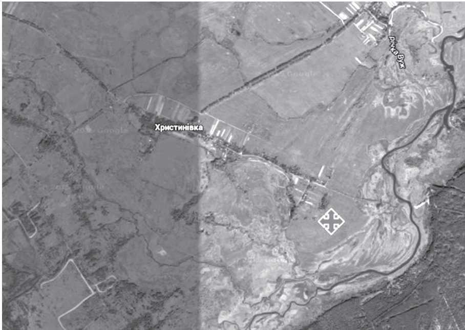
Рис. 1. Знімок дослідного поля з супутника

р. Уж — на землях, виведених з сільськогосподарського користування внаслідок радіоактивного забруднення у 1986 р.