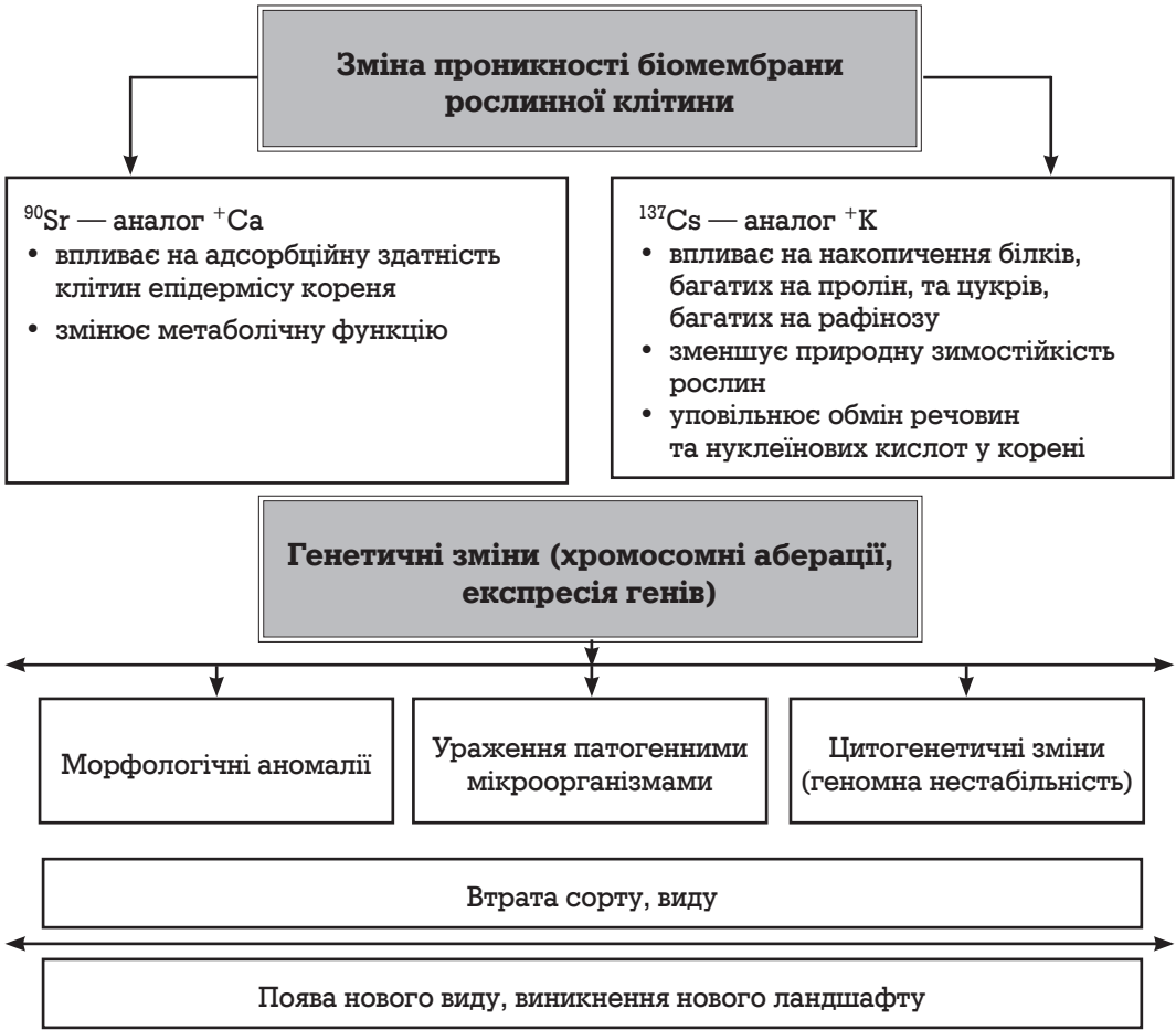
Рис. 1. Вплив радіонуклідів на рослинну клітину

межі залежно від виду та сорту рослини. У клітині існують ще репаративні механізми, завдяки яким швидко відновлюються метаболічні процеси за участю органічних кислот та специфічних білків, як-от фітохелатів та феритинів. На жаль, навіть ці механізми не дають змоги уникнути критичної акумуляції радіонуклідів у клітині. Вона накопичує їх лише до певного рівня, перевищення якого спричиняє неминучу її загибель. Всі рослини родини бобових є кальцефілами і можуть поряд із кальцієм нагромаджувати у значних кількостях його хімічний аналог — ^{90}\text{Sr} , створюючи умови для значного внутрішнього опромінення цих рослин. Радіостронцій