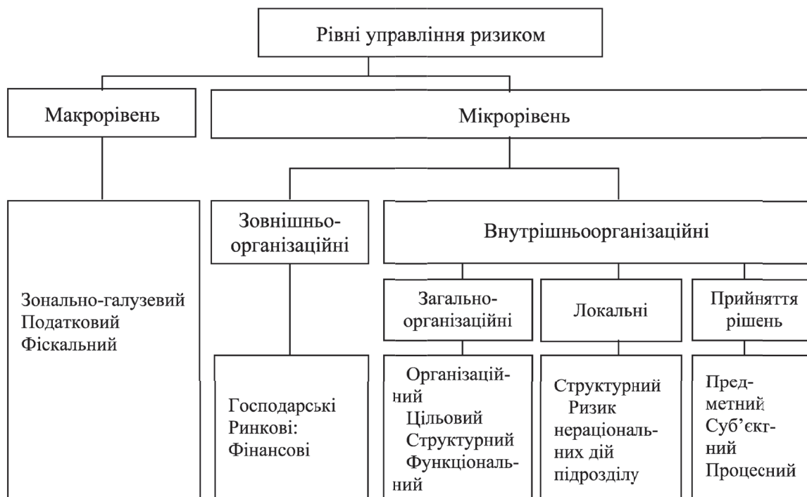
Рис. 3. Класифікація підприємницьких ризиків виробників хмелю (аспектна)