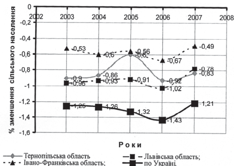
Рис. 1. Річна динаміка зміни кількості сільського населення