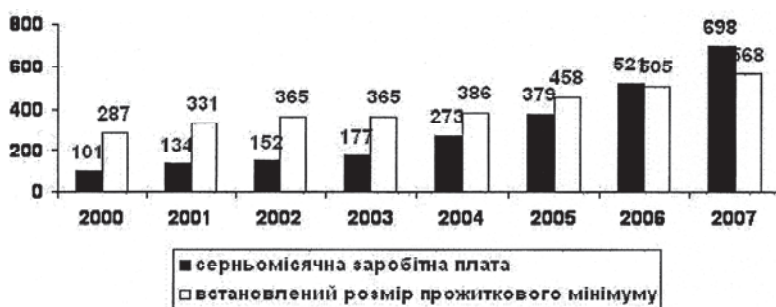
Рис. 2. Середньомісячна заробітна плата працівників сільського господарства в Житомирській області та встановлений розмір прожитковий мінімум