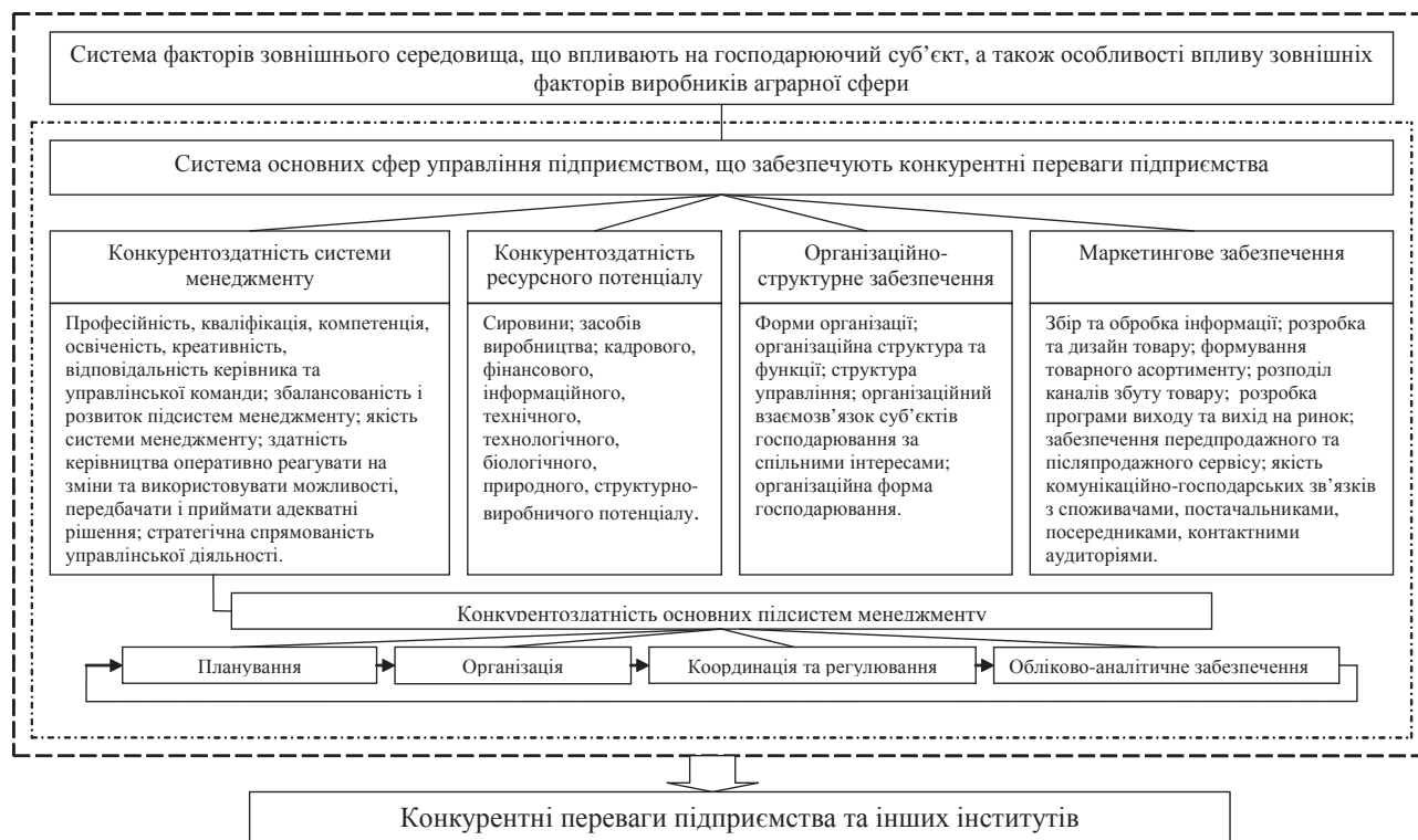
Рис. 1. Сукупність факторів забезпечення конкурентних переваг підприємства як системи