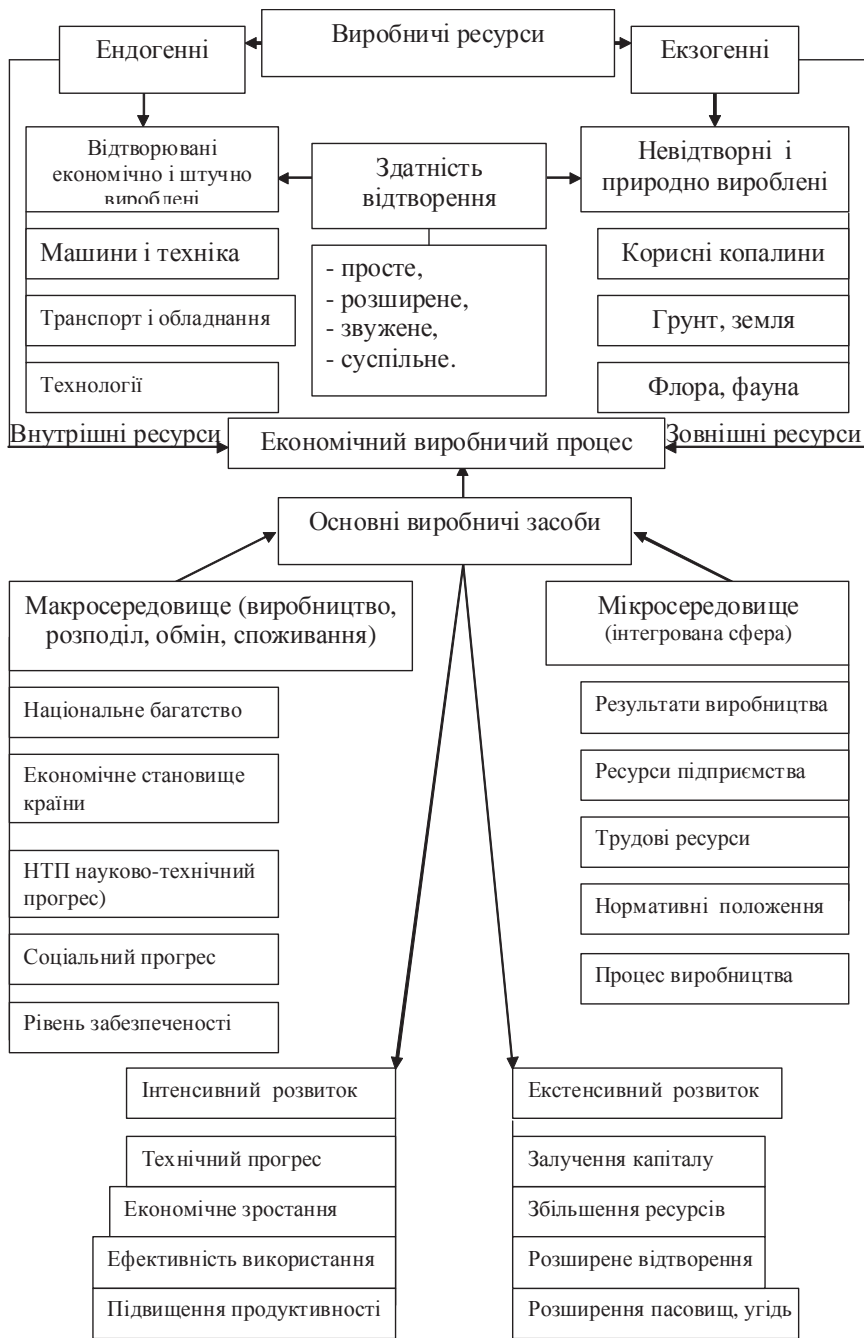
Рис. 3. Класифікація виробничих ресурсів у економічній системі

інтенсивним є таке виробництво, "коли застосовуються більш ефективні засоби виробництва", а екстенсивне — "коли розширюється тільки поле виробництва". Отже, він розглядає інтенсивне виробництво, коли збільшуються його масштаби в даному підприємстві за рахунок технічного поліпшення, що веде до підвищення інтенсивності та продуктивності праці, одночасно із ефективним використанням уже функціонуючих основних засобів, тоді як екстенсивне виробництво здійснюється за рахунок використання функціонуючої уречевленої та збільшення живої праці, тобто без застосування нової техніки і