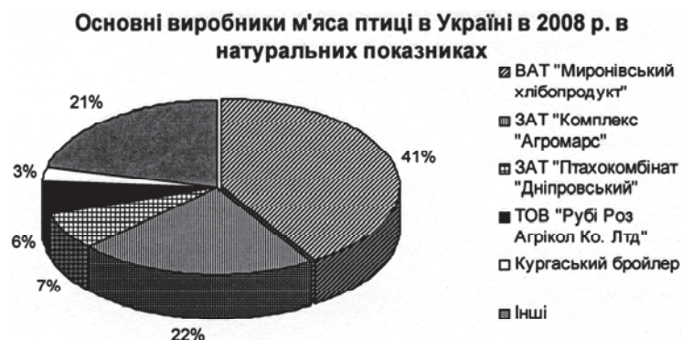
Рис. 3. Структура часток ринку м'яса птиці

хлібопродукт", який займає близько 41% промислового виробництва м'яса птиці. Окрім групи підприємств ВАТ "Миронівський хлібопродукт", на ринку виробництва м'яса птиці в національному масштабі присутні такі компанії, як ЗАТ "Комплекс Агромарс" (ТМ "Гаврлівські курчата"), ТОВ "Рубі Розу Агрікол", ЗАТ "Птахокомбінат "Дніпровський", ВАТ з Іноземними Інвестиціями "Курганський бройлер" [5].