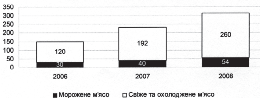
Рис. 2. Структура виробництва м'яса птиці промисловими підприємствами