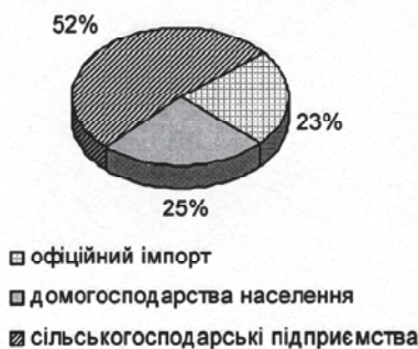
Структура постачання м'яса птиці на ринок України у 2008 році