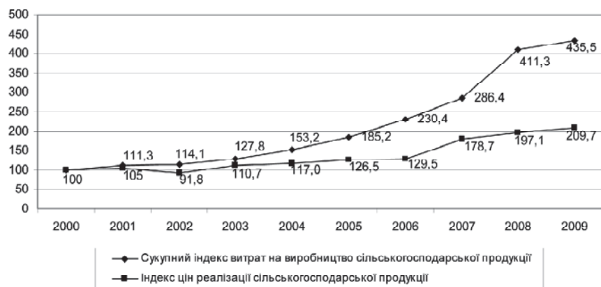
Рис. 1. Індекси витрат на виробництво сільськогосподарської продукції та цін реалізації сільськогосподарської продукції*