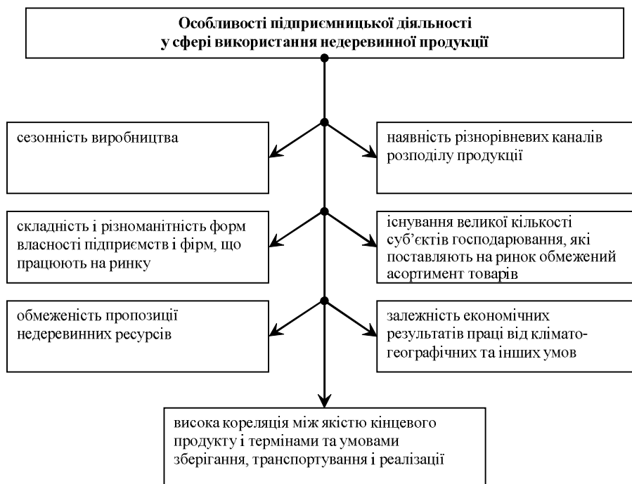
Рис. 2. Особливості підприємницької діяльності у сфері використання недеревинної продукції

Реалізація основних завдань підприємницької діяльності у сфері відтворення та охорони лісів не можлива без створення таких інституціональних форм господарювання, де збережеться право держави на лісові блага, але при цьому не буде нейтралізована приватна ініціатива. Такими інституціональними формами можуть виступати окремі інститути державно-приватного партнерства, тим більше інституціональне підґрунтя для їх імплементації вже створено [9].