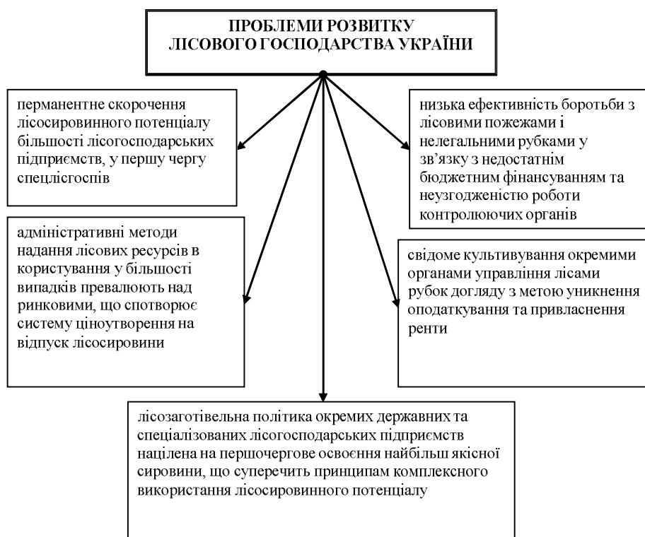
Рис. 1. Проблеми розвитку лісового господарства України

ного господарського комплексу, яка потребує найбільш зваженого підходу щодо визначення та реалізації окремих пріоритетів розвитку підприємницької діяльності. Це викликано в першу чергу тим, що ця сфера безпосередньо торкається фундаментальних основ людської життєдіяльності і посилення суперечностей в ній призведе до напруження ситуації в соціо-екосистемах у формі підвищення техногенного тиску на довкілля, розширення масштабів ресурсно-екологічної небезпеки використання природних ресурсів, частішого виникнення природно-екологічних катастроф [1; 2]. Тому особливою гостротою відзначається проблема вдосконалення інституціонального середовища становлення підприємницьких структур, які визначають межі, обсяги, форми і методи освоєння окремих складових лісоресурсного потенціалу та взаємодії з навколишнім середовищем.