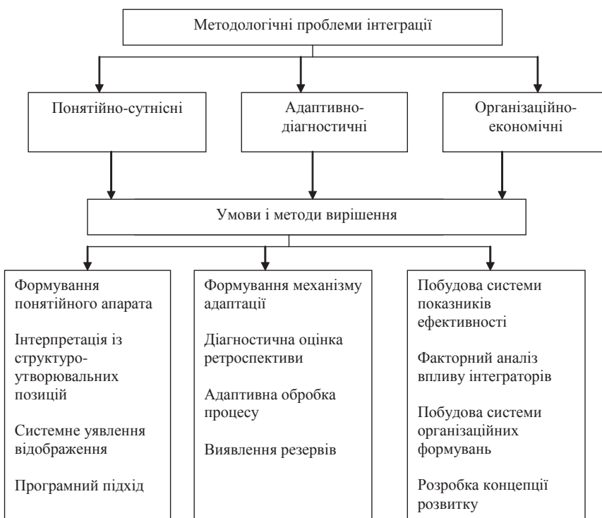
Рис. 1. Взаємозв'язок проблем інтеграції і умов їх вирішення (власна розробка)

Концептуальною основою побудови понятійного апарату і розкриття через нього сутності інтеграції може служити визначення, в якому термін "інтеграція" означає "стан зв'язаності окремих диференційованих частин в ціле; а також процес, що веде до такого стану" [2, с. 307]. З цього визначення виходить, що інтеграція інтерпретується з двох позицій — дискретності, а отже, статичності й безперервності,