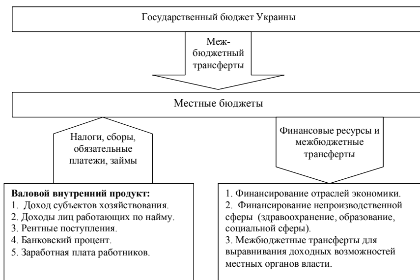
Рис. 1. Роль местного бюджета в распределении валового внутреннего продукта (составлено автором)

экономического роста, увеличения инвестиционной активности на уровне административно-территориальных образований. С другой стороны, через них осуществляется финансирования минимальных социальных потребностей