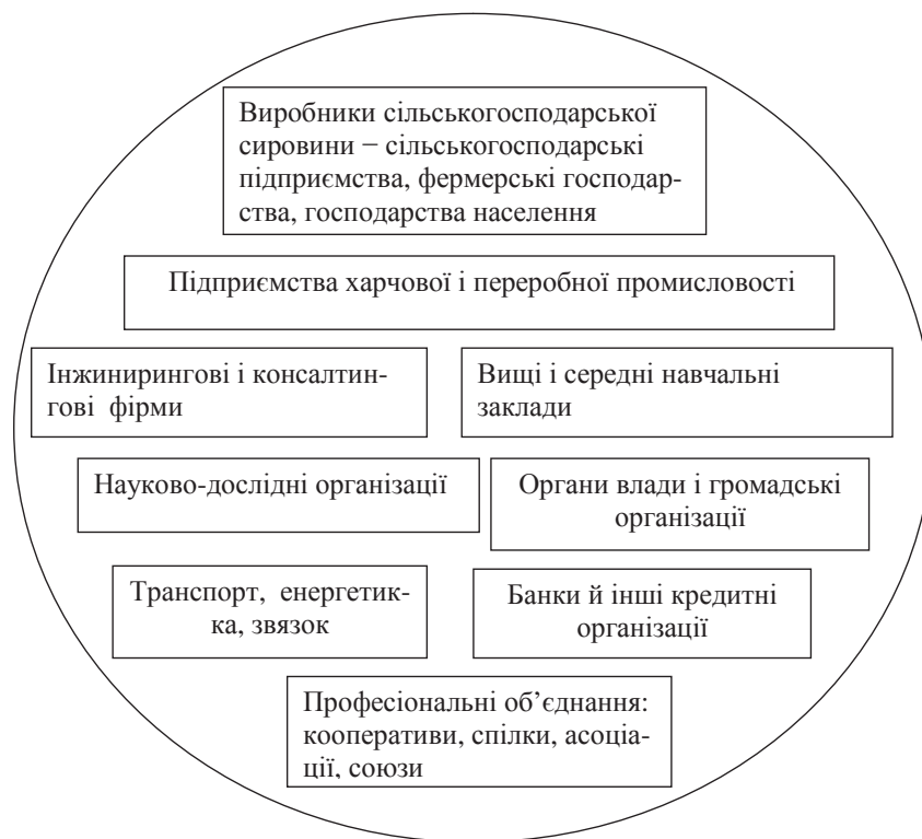
Рис. 2. Структура агропромислових кластерів регіонального АПК