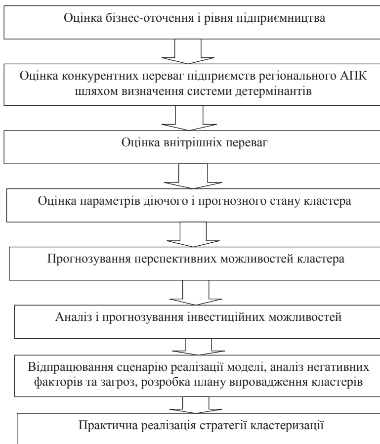
Рис. 3. Модель формування стратегії створення і розвитку агропромислових кластерів регіонального АПК

витку регіональної економіки і стратегія розвитку агропромислових кластерів повинні бути взаємно погоджені (рис. 1).