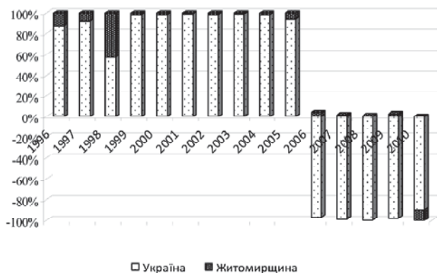
Рис. 1. Динаміка сальдо зовнішньої торгівлі Житомирської області та України, 1996—2010 рр., % [7; 8; 9; 10]

95[6,с. 17]. Найбільшими, постійними країнами-партнерами стали; Росія, Німеччина, Італія, Білорусія. Розширення географічного діапазону зовнішньоекономічної діяльності за 20 років вказує на розвиток інтеграційних векторів зовнішньоекономічної торгівлі як до країн ЄС так і, до країн США. Підкреслюється значення кожного вектора для позитивного розвитку економіки регіону. Протиставляти ці напрями зовнішньоекономічної діяльності та створювати дискусійні питання із цього приводу є вкрай не доцільним, оскільки це суперечить тенденціям розвитку зовнішньоекономічної діяльності Житомирщини та й України в цілому.