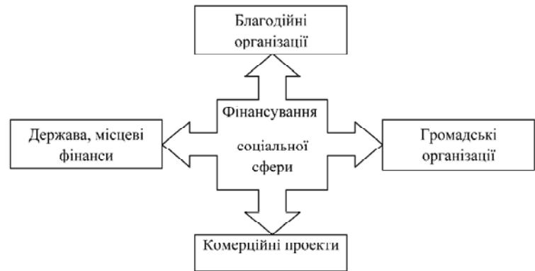
Рис. 3. Комплексна модель фінансування системи соціального захисту

Проблема суб'єктивності оцінок знаходить свій вияв і в збиранні, опрацюванні та аналізі інформації, яка лежить в основі прийняття проектних рішень. Тому рішення по оцінці соціальних аспектів проектування значною мірою залежать від соціальної і культурної орієнтації розробників проекту. Адже саме їм необхідно визначити наслідки й результати проекту, обрати критерії порівняння, виро-