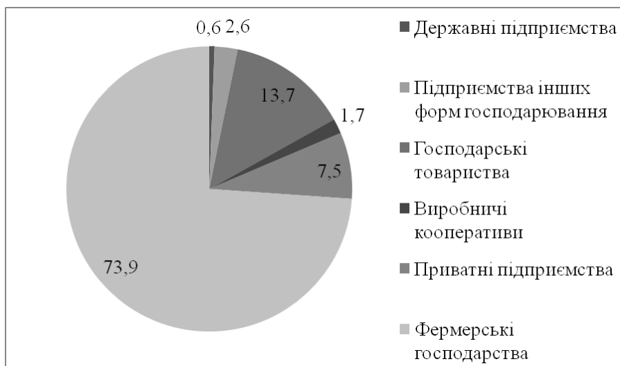
Рис. 2. Структура сільськогосподарських підприємств за організаційно-правовими формами господарювання у 2010 році

Державні сільськогосподарські підприємства представлені, в першу чергу, спеціалізованими господарствами, що знаходяться в структурі закладів освіти і певних наукових установ і виступають базою їх наукової діяльності. Саме завдяки збереженню ними цілісних майнових та земельних комплексів, а також завдяки певній підтримці