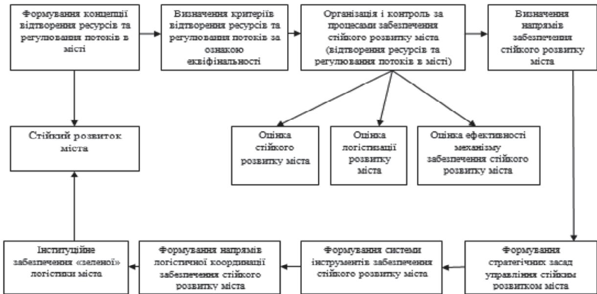
Рис. 2. Механізм забезпечення стійкого розвитку міста