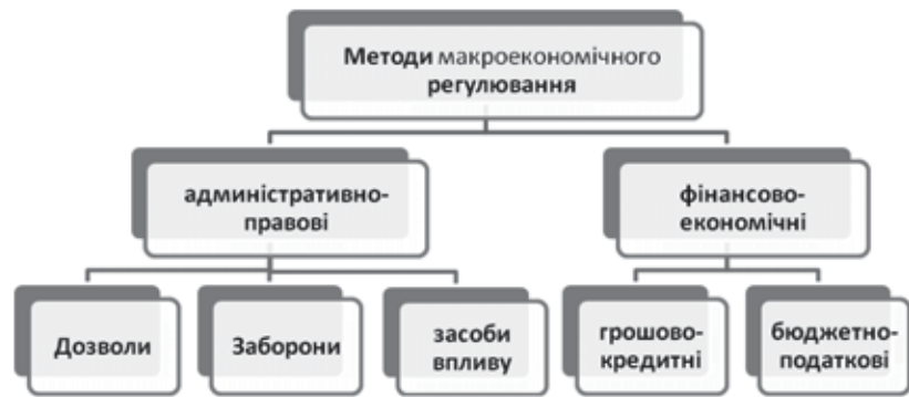
Рис. 1. Методи макроекономічного регулювання розвитку регіонального туристично-рекреаційного комплексу

Адміністративно-правові методи застосовуються з метою створення певних "правил гри" у цій сфері і ґрунтуються на регулюючих діях щодо забезпечення правової інфраструктури.