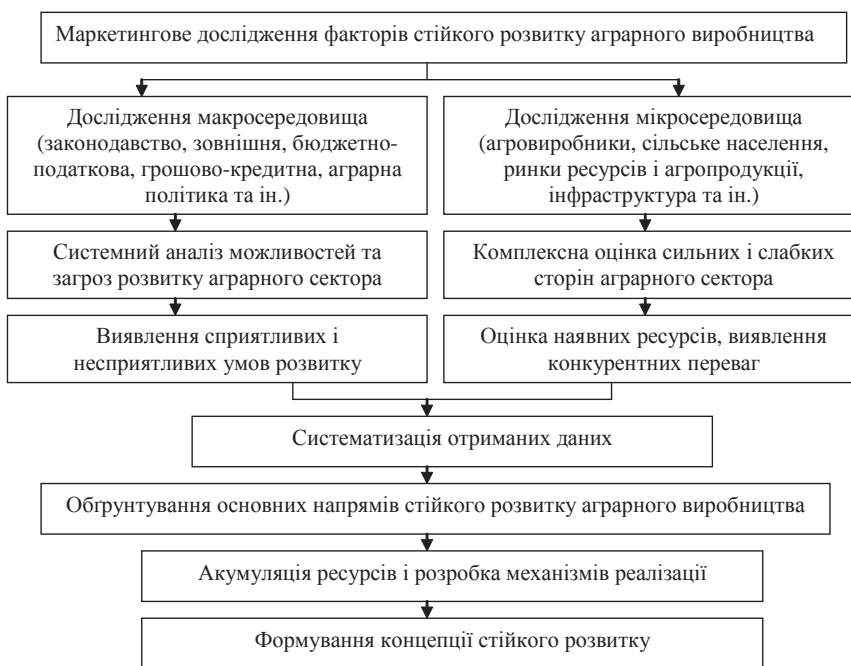
Рис. 2. Алгоритм формування концепції стійкого розвитку аграрної сфери з використанням інструментарію маркетингового аналізу

/ П.И. Чехлянь // Проблемы и перспективы повышения конкурентоспособности российской экономики. Материалы XXV Международной научной конференции по экономике. 4.1. — Краснодар: изд-во КубГАУ, 2004. — С. 333 — 341.