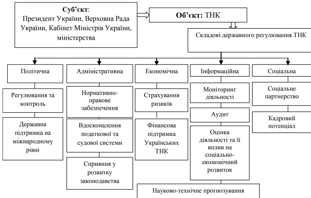
Рис. 1. Модель державного регулювання діяльності ТНК в Україні