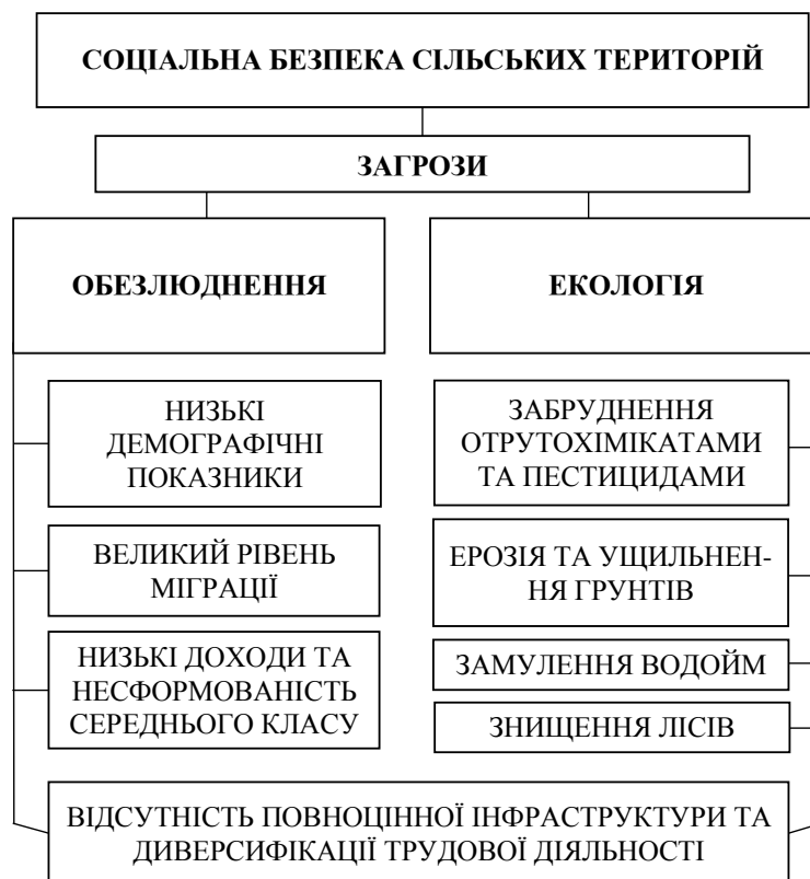
Рис. 2. Базові загрози соціальній безпеці сільських територій

понтентів вважають, що не зможуть повернути отриманий кредит [11]).