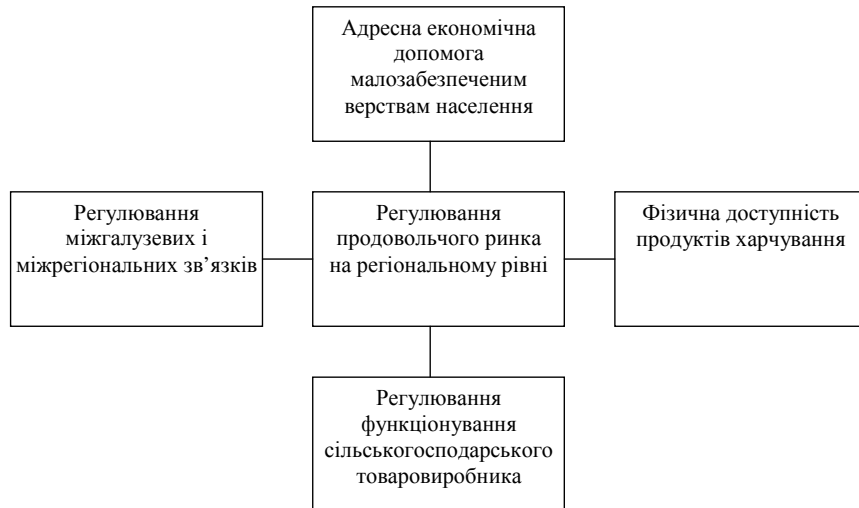
Рис. 3. Регулювання регіонального продовольчого ринку

2. Богачев В. И. Значение анализа экономической безопасности регионов Украины / В.И. Богачев, Е.В. Коваленко // Економіка АПК . — 2009. — № 5. — С. 10—17.